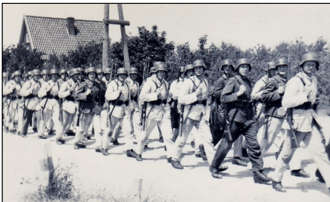
Duitse terugtocht in 1945 op de Stationsstraat