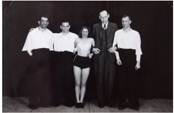
De Engverdi's met twee circus-collega's in 1942, ergens in Duitsland.

Tijdens de Tweede Wereldoorlog werden jonge mannen en vrouwen uit door Duitsland bezette gebieden gedwongen om in de nazi-Duitse oorlogseconomie Duitse mannen te vervangen die als soldaten dienden. Ook uit Tegelen en Steyl zijn inwoners ingezet in Duitsland. In de eerste jaren gebeurde dit met een salaris. In de laatste jaren werden inwoners steeds vaker verplicht te werken zonder vergoeding. Het Nederlandse Rode Kruis (NRK) verzamelde na de oorlog gegevens van de tewerkgestelden. Deze Collectie Arbeidsinzet is online gekomen op de website van het Nationaal Archief. We vinden daar ook gegevens van meer dan 250 mannen en vrouwen uit Tegelen en Steyl. Er ontbreken er nog velen op de lijst.